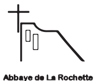
Abbaye de La Rochette